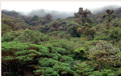
Regnskov i Nicaragua