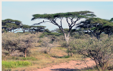
Savanne i Tanzania